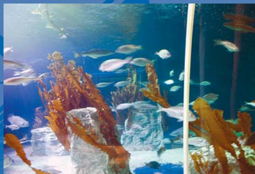
Die Unterwasserwelt der Nordsee kann im SEALIFE in Cuxhaven bestaunt werden