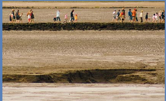
Wanderer im Watt. Im Vordergrund ein Priel

Dorum-Neufeld selbst ist ebenfalls interessant. Wattenmuseum, Deichmuseum, historischer Leuchtturm, Meeresschwimmhalle mit Wellenbad und vieles andere mehr laden zum Besuch ein. Natürlich dürfen hier nicht die vor Ort befindlichen und gut geführten Gaststätten vergessen werden, die zum Schlemmen einheimischer Spezialitäten einladen. Dabei sticht besonders der „Wattwurm“ heraus.