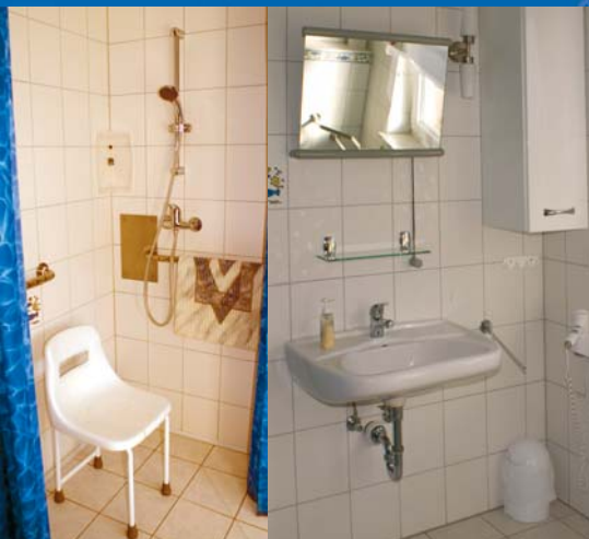
Bad und Toilette befinden sich auf dem neuesten Stand der Technik