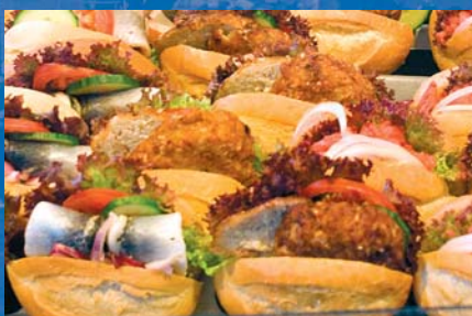
Wer an der Nordsee „vom Fleische fallen“ sollte, ist selbst daran schuld. Selbst einfache Fischbrötchen werden durch liebevolle Zubereitung zu Delikatessen