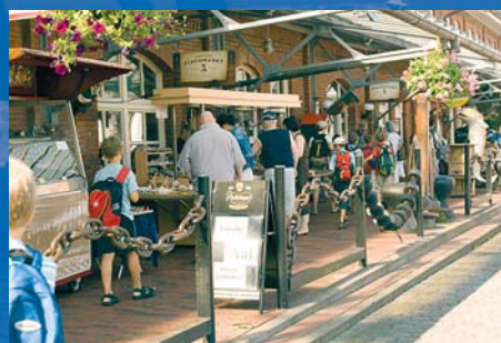
Früher Räuchereien - heute eine Passage - eine echte Touristenfalle