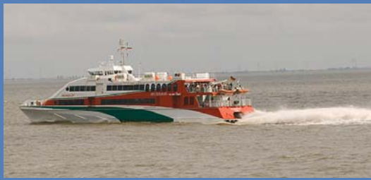
Mittels Katamaran und mit 70 km/h zur Insel Helgoland