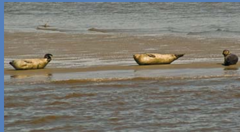
Ein Sonnenbad auf den Robbenbänken