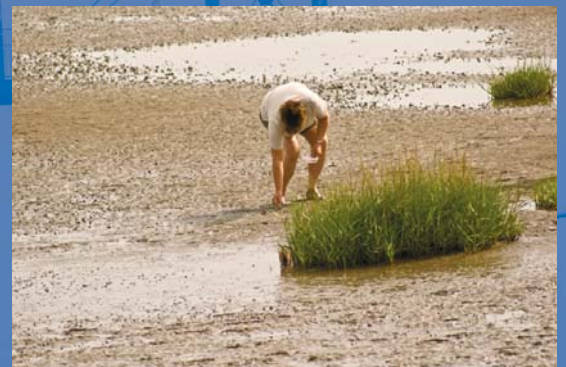
Im Watt kann man interessante Entdeckungen hinsichtlich Tier- und Pflanzenwelt machen