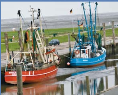
Krabbenkutter bei Ebbe