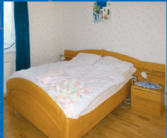
Ein Schlafzimmer (bei Bedarf mit Pflegebett) und ein Schlafzimmer mit drei Betten für Kinder/Gäste sind vorhanden. Ebenfalls vorhanden sind Hilfsmittel wie Rollator, Einhandtablett u.v.a.m..