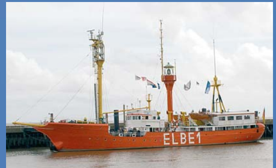
Das Feuerschiff „Elbe 1“ liegt in Cuxhaven vor Anker und lädt zu Besuchen ein