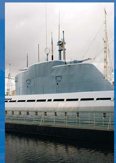
Das U-Boot „Wilhelm Bauer“ im Museumshafen in Bremerhaven