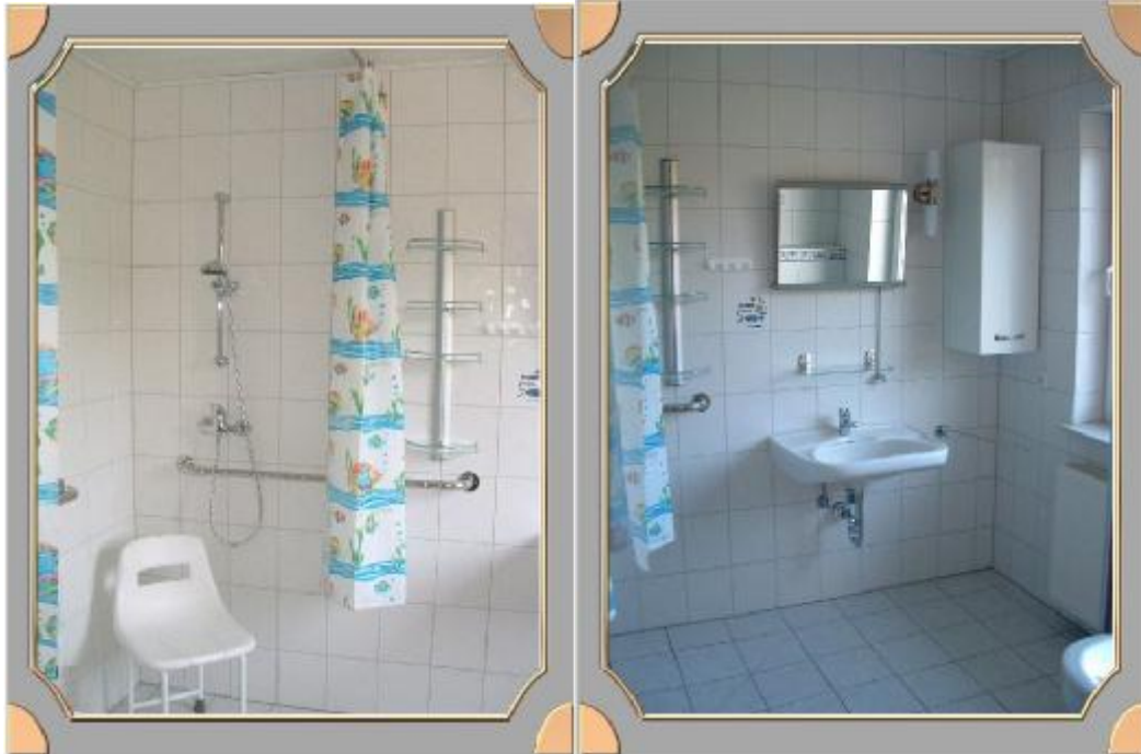
ebenerdige Dusche, stabiler Duschstuhl, unterfahrbares Waschbecken

(kann aber auch ohne Einschränkungen von Personen ohne Handicap genutzt werden)