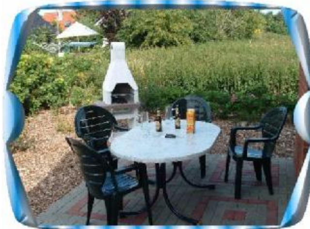
Rollstuhlfahrer wissen das zu schätzen