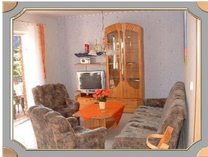
vom Wohnzimmer ohne Stufen zur Terrasse

Was als erstes im Wohnzimmer auffällt, ist die große nach Süden ausgerichtete Fensterfront, die einen direkten Zugang zu Terrasse darstellt. Der Süd-West Ausblick sorgt für eine gemütliche Atmosphäre am Abend. Das Sofa ist als Extrabett auszuklappen. Auf Wunsch kann ein Kinderreisebett gestellt werden.